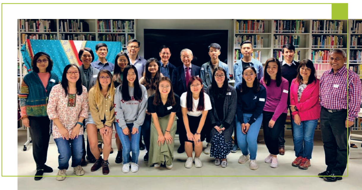
講座和工作坊後合照