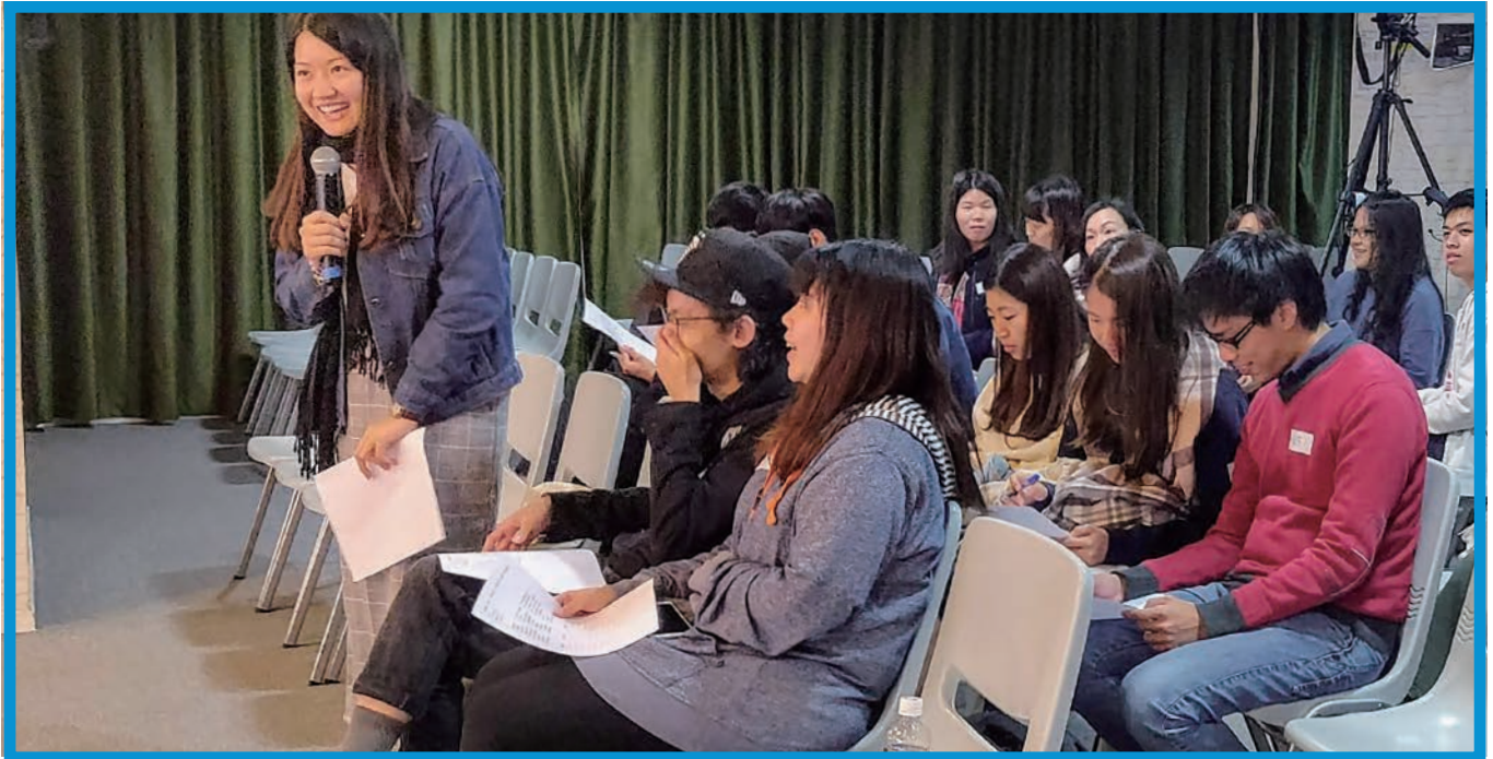
農曆新年前還可面對面進行友師培訓

正當 Project-C「師友計劃」在一月如火如荼的展開之際，突然疫情來襲，農曆新年後學校便停課了，所有課外活動也暫停了。我們和友師都十分惆悵，尤其是很多友師才剛剛與他們的青少年友員見過一面，彼此還不是很熟悉，更有兩所學校的師友計劃未能展開。我們苦苦思量：在這當下，我們能做什麼？從滿心期待三月開學到希望一次又一次的落空，我們決定不能坐以待斃，即使大家被逼隔離，並不代表關係隔斷；友師必須主動與他們的青少年友員聯繫，包括對他們噓寒問暖，關心他們夠不夠口罩……而這一切，都需要在網上進行。