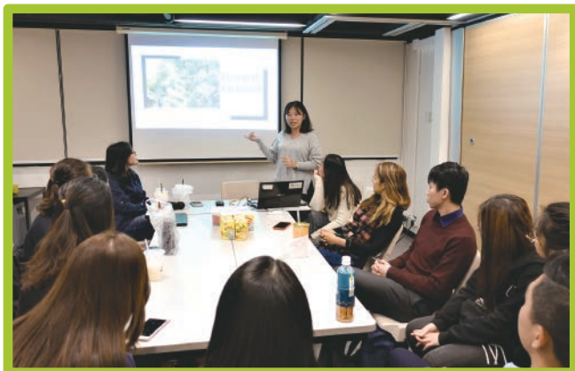
過去參加者分享交流經驗