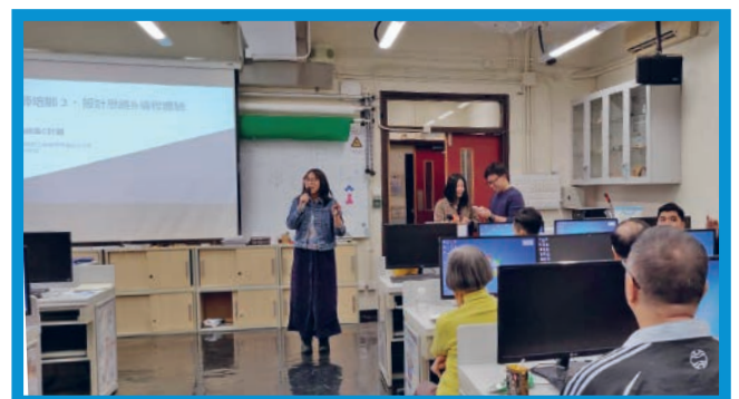
農曆新年前還可面對面進行友師培訓

最後，在這疫境中，祝大家身心康泰！願我們有屬天的智慧，心意不斷更新而變化，在這萬變的世界中得著平靜安穩！🌈