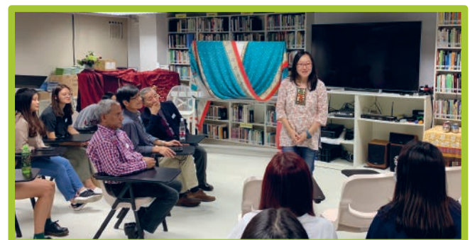
2019 印度項目正式開始

若然如與各國元首所說，是次的疫情是一場戰爭；那要「泰山崩於前而色不變，麋鹿興於左而目不瞬」便得看我們是否有好好保守自己的心，不讓疫症如獅子般的咆吼和生活中千變萬化的變遷恐嚇來盜取我們心中主所賜下出人意外的平安。但願能認清對手，堅心依靠主的幫助，必然能見證主的榮美與大能！於這場疫戰中得勝、並且得勝有餘！