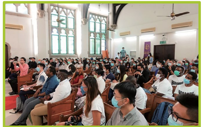
▲ 當日活動座無虛席

聯合國將每年的6月20日定為「世界難民日」。今年的世界難民日，我們繼續與一眾香港難民事工小組(The Hong Kong Refugee Ministry Group)的成員合作舉辦活動，主題為「二零二零世界難民日：我們城市裡的寶藏」(2020 World Refugee Day — Treasures In Our City)。是次活動希望讓社會瞭解難民和尋求庇護者群體並非單純的被支援角色，相反他們有著多元且豐富的才能，正為社會作出貢獻。同樣受到疫情及限聚令的影響，我們今年嘗試實體和線上同步進行。起初籌備活動時，成員們都考慮到限聚令而限制實體聚會的出席人數。活動前一星期，政府便放寬限聚令，室內活動不受措施影響。因此可以有更多人參與當日活動。感恩能夠讓大眾親身感受難民和尋求庇護者群體的才能，以及令難民和尋求庇護者知道在香港有人關心他們。活動當日，幾位過往參加Project Just-Comp及今年參與迦納計劃的參加者一起擔當義工，協助大會攝影，她們表示非常開心和享受參與今年的活動。