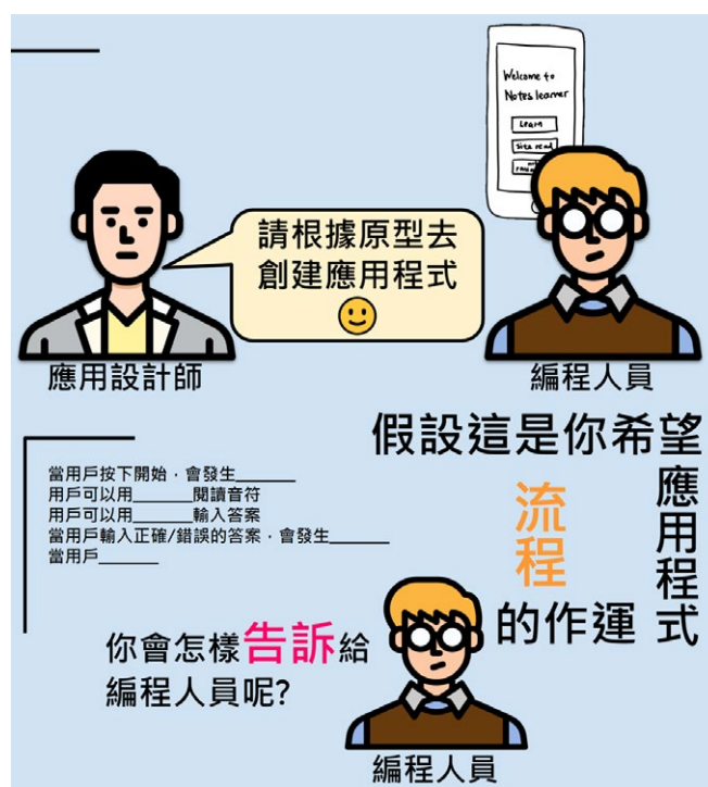
▲ 實習生幫助我們修改課程，加入更多影音動畫元素，增強趣味和互動性。

一天的難處一天當就夠了。願我們放下一切的憂慮，跟隨上帝一步一步走下去，看到祂帶領我們的恩典之路。☀️