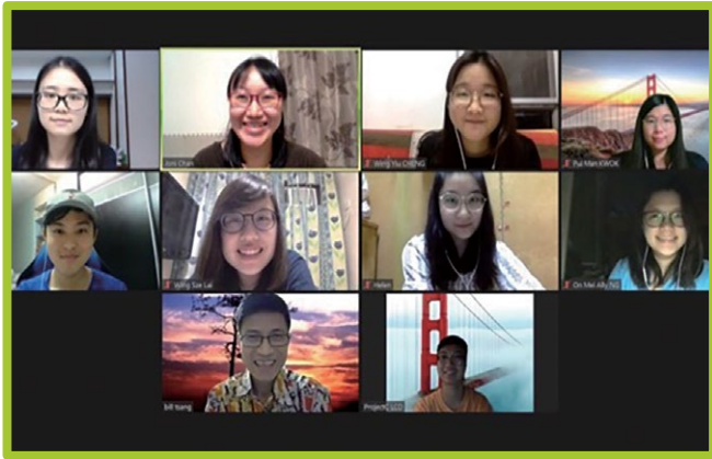
▲ 迦納計劃的網上講座

面對未知和不確定的狀況，人會憂慮與不安。這是正常的反應，亦即表示「自我保護機制」的啟動。可是長時間或過份的憂慮便會影響我們的日常生活。這短短幾個月，香港面對前所未有的轉變，國安法的實施、第三波疫情等等，面對以上的狀況，你憂慮嗎？