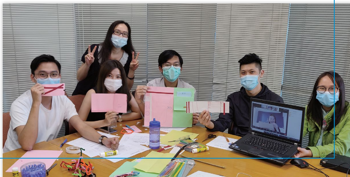
▲ 與香港科技大學的實習學生進行「設計思維工作坊」。在暑假，實習學生成為我們的祝福！