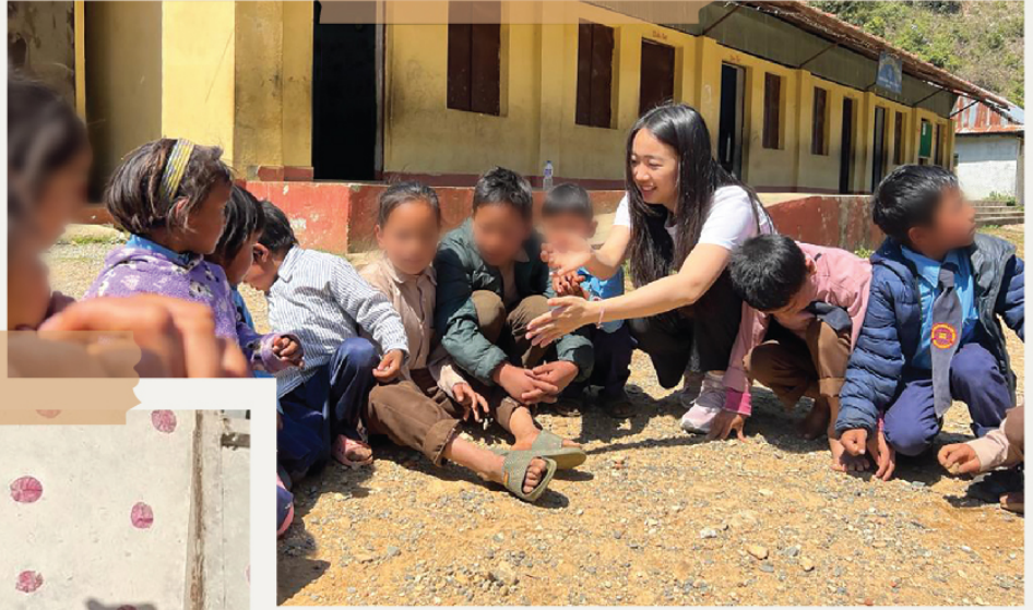
▲ 在操場上和孩子們一起玩耍