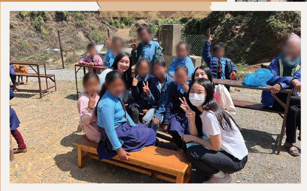
▲ 在鄉村地區小學與孩子們度過一段快樂的遊戲時間之後