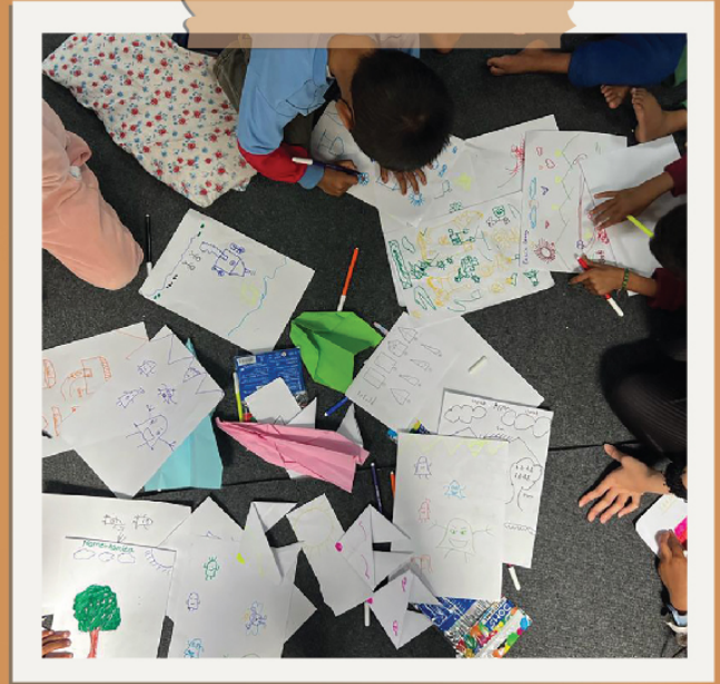
▲ 在兒童節當天和SDSS的孩子們一起畫畫