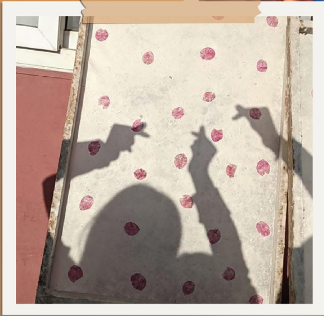
▲ 拜訪公平貿易生產商Get Paper

透過參加由青年全球網絡(YGN)舉辦的尼泊爾計劃2023，我從各方面學習到了很多。計劃分為三個部份：尼泊爾之旅、師友計劃和旅程後的本地服務。師友計劃讓我有機會向一位香港中文大學新聞與傳播學院的教授學習，而本地服務則讓我能與朋友們一起服務他人。我認為尼泊爾之旅是整個計劃當中的亮點。透過這次旅程，我能夠深入地了解社會議題，透過聆聽、體驗、參與和反思學習。